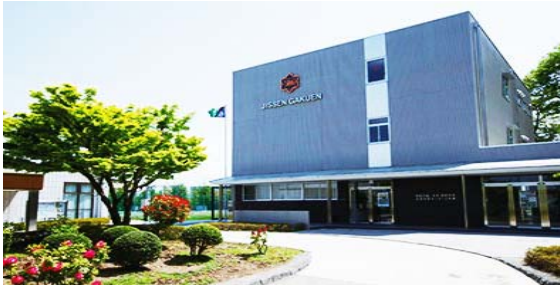
〈実践学園高尾総合グラウンド〉